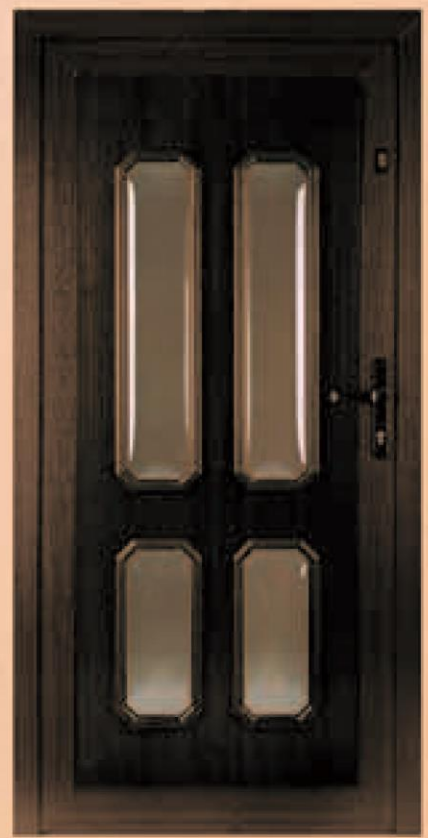
dakota ciemny dąb oszklenie antisol brąz wypukły