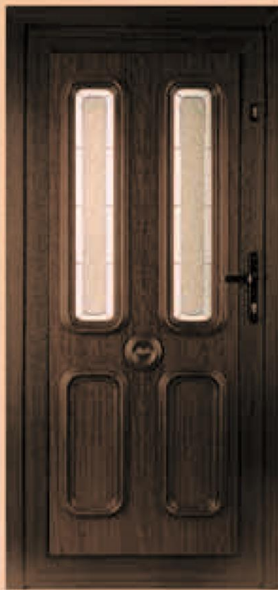
new york ciemny dąb oszklenie WK-012