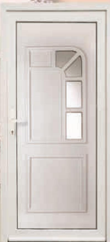
pensylwania biały oszklenie refleks brąz