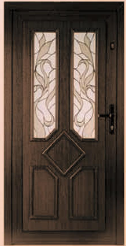
carolina ciemny dąb oszklenie WK-010