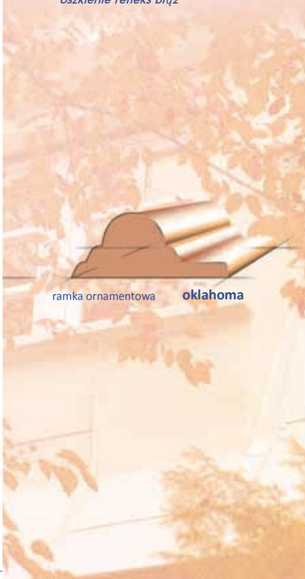
ramka ornamentowa oklahoma