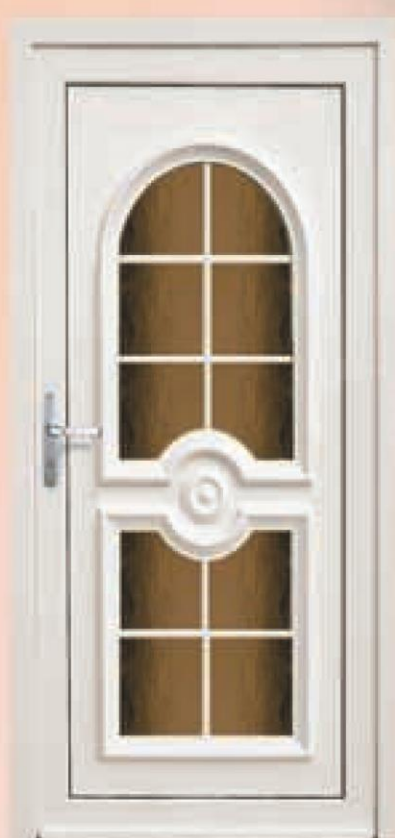
oregon biały oszklenie silvit brąz