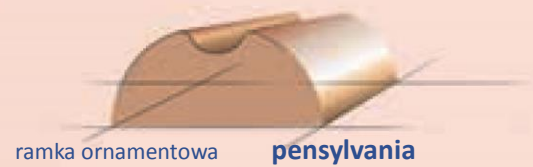
ramka ornamentowa pennsylvania