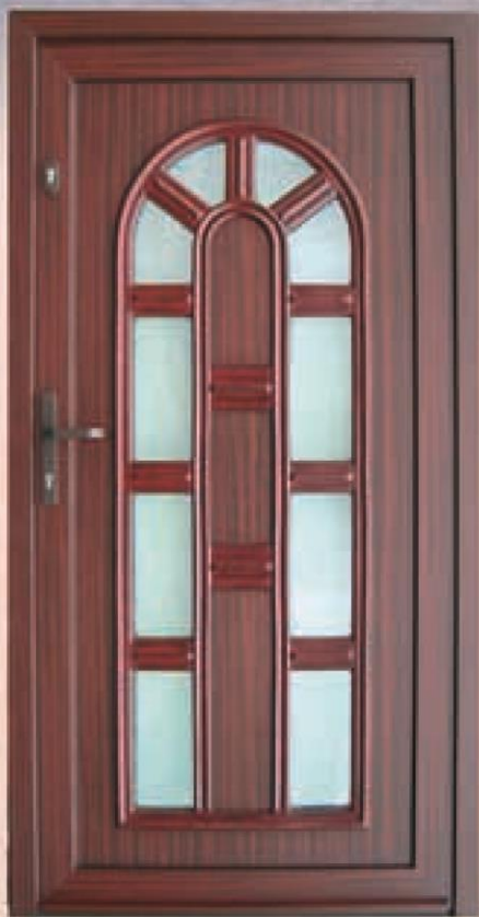
texas mahoń oszklenie delta biały