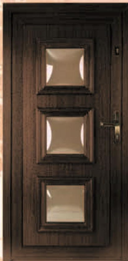
connecticut ciemny dąb oszklenie antisol brąz wypukły