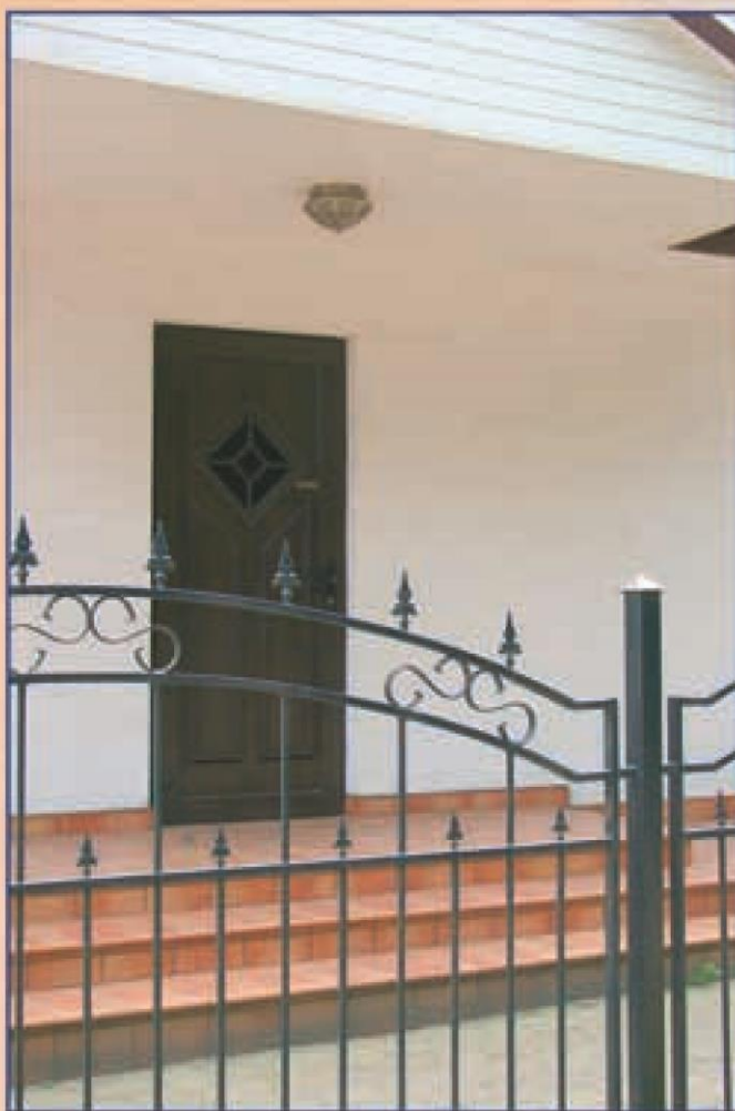
missouri ciemny dąb oszklenie antisol brąz