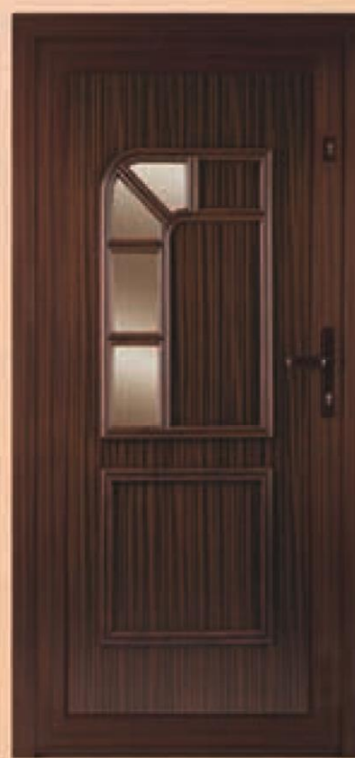
pensylwania mahoń oszklenie antisol brąz