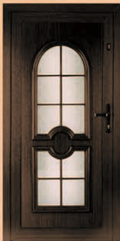
oregon ciemny dąb oszklenie orna 77