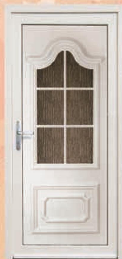
arizona biała oszklenie niagara białe