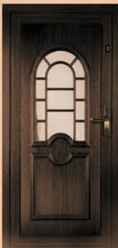
tennesse ciemny dąb oszklenie altdeutsch