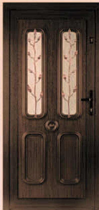
new york ciemny dąb oszklenie Delta