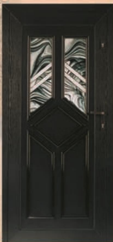
mississippi palisander oszklenie WK-016