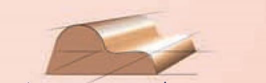
ramka ornamentowa montana, connecticut, nevada, mexico, rhode island