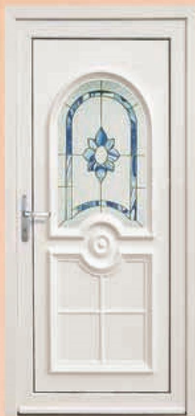
oregon biały oszklenie WK-002