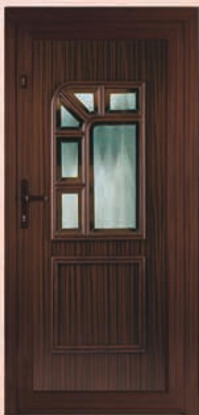
pensylwania mahoń oszklenie WM-005