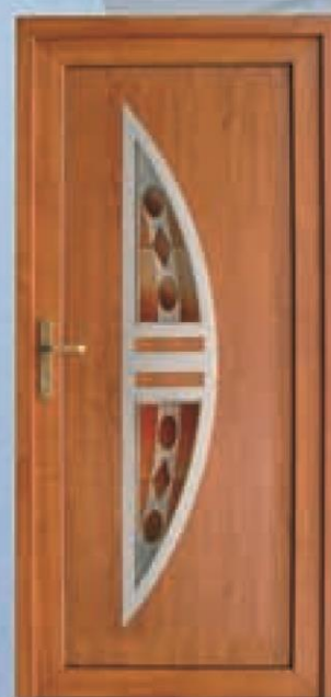
Kansas złoty dąb

Nowość!! szlachetne wykończenie ze stali