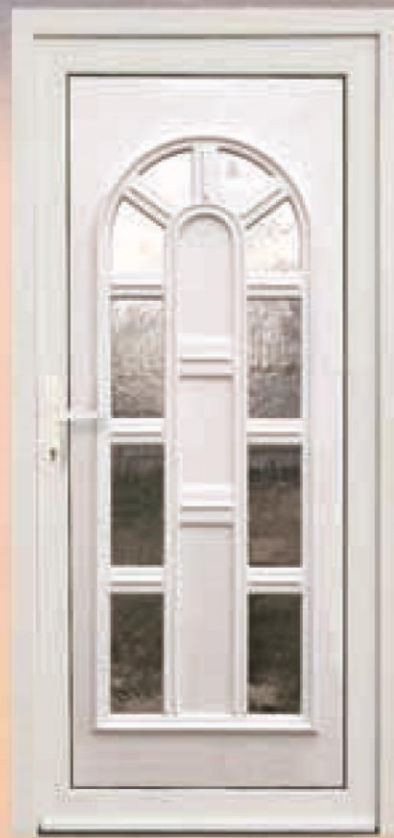
texas biały oszklenie częściowe altdeutsch biały