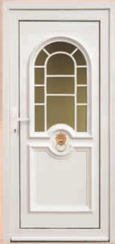
tennesse biały oszklenie refleks brąz