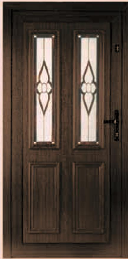
nevada ciemny dąb oszklenie WK-011