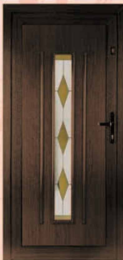
georgia ciemny dąb oszklenie witraż WK-015