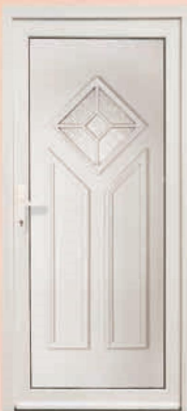
missouri biały oszklenie delta biała