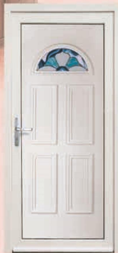
montana biała oszklenie WK-007