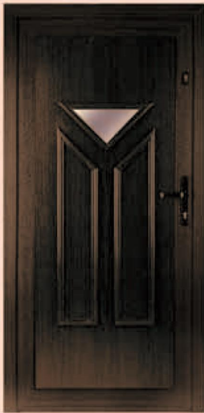
idaho ciemny dąb oszklenie refleks brąz