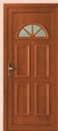
montana złoty dąb oszklenie orna 77