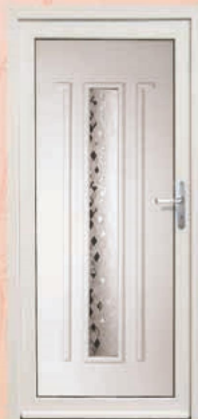
georgia biały oszklenie geo białe