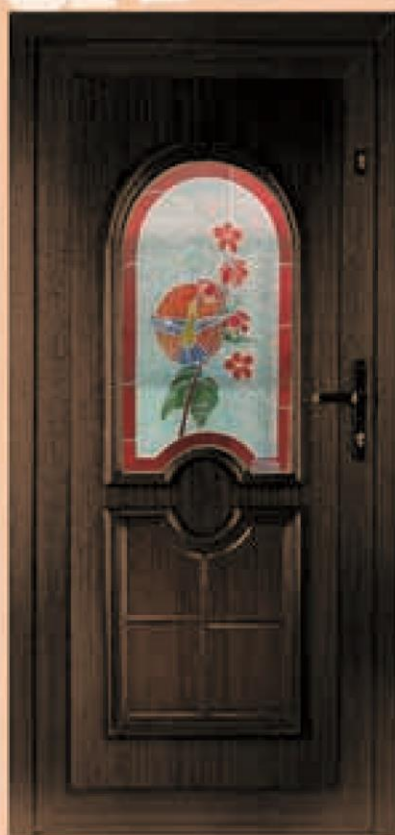
oregon ciemny dąb oszklenie WM-021