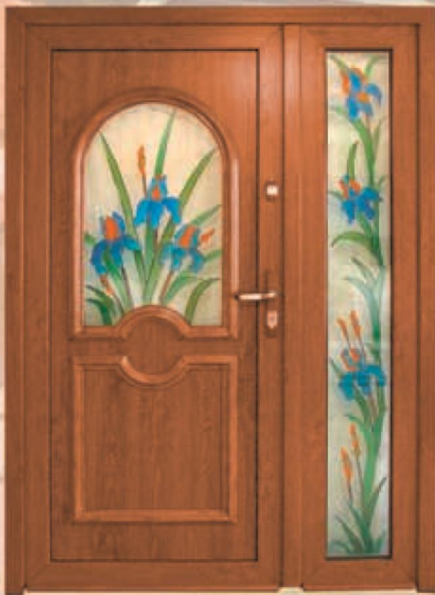
tennesse złoty dąb oszklenie WM-027