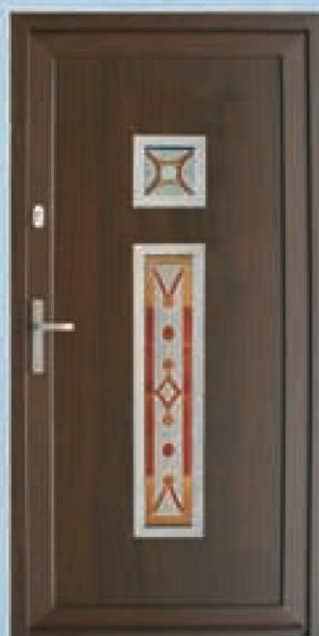
Deleware ciemny dąb