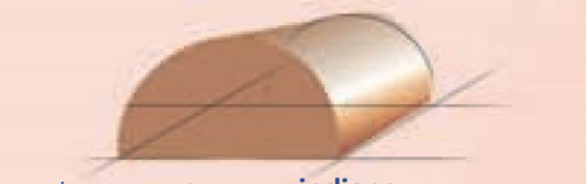
ramka ornamentowa indiana