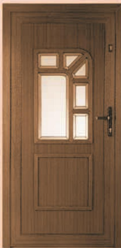
pensylwania dąb rustikalny oszklenie WM-005