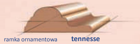
ramka ornamentowa tennesse