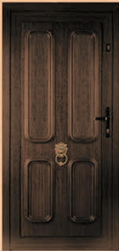
new york ciemny dąb bez oszklenia