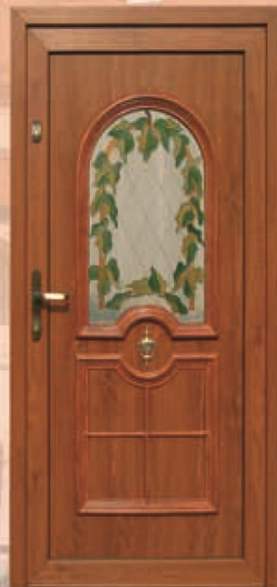
oregon złoty dąb oszklenie WM-022