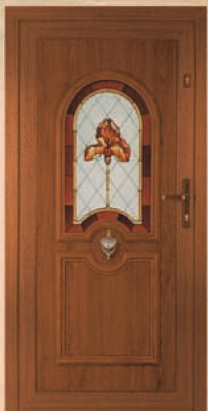
tennesse złoty dąb oszklenie WM-004