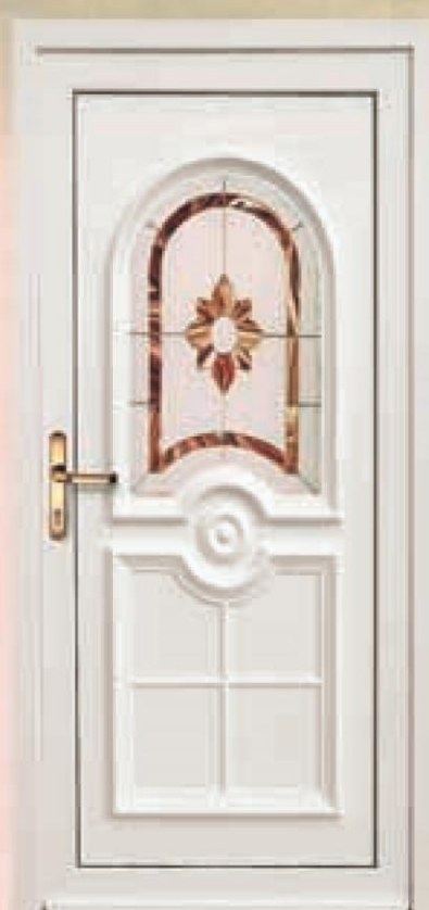
oregon biały oszklenie WK-002B