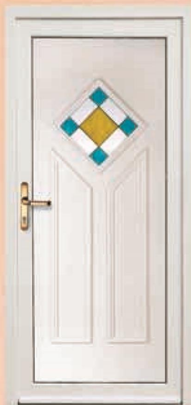
missouri biały oszklenie WK-014