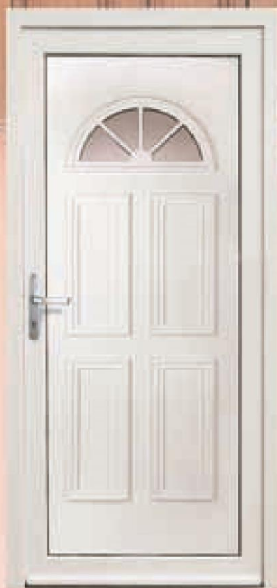
montana biała oszklenie refleks