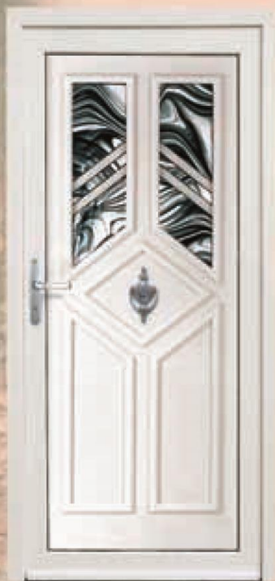
mississippi białe oszklenie WK-016