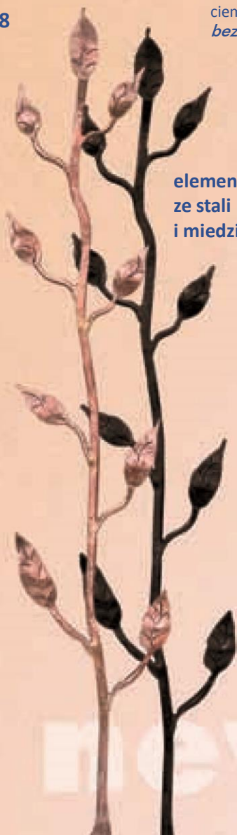
elementy kute ze stali i miedzi