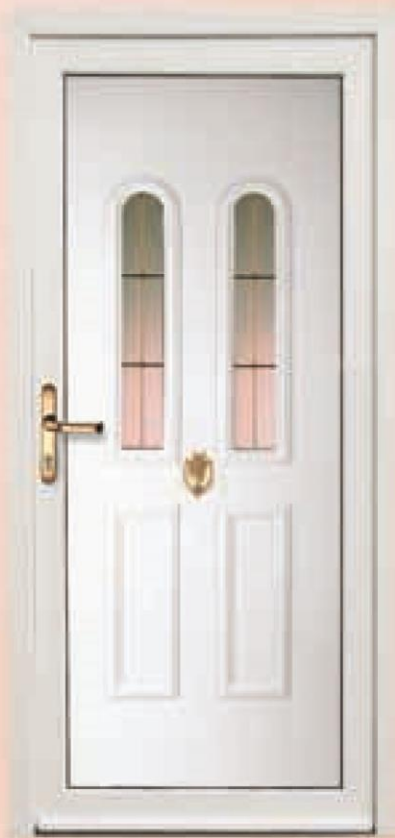
hampshire biały oszklenie refleks brąz + szpros wewnętrzny złoty