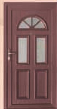
montana mahoń oszklenie orna 77