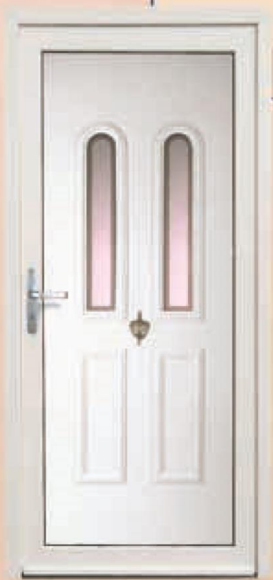
hampshire biały oszklenie antisol, brzegi piaskowane