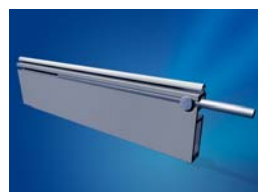
Walek + wieszaki zabezpieczające

Rolety MINIROL i TRADIROL wyposażone są w najlepsze zabezpieczenia.